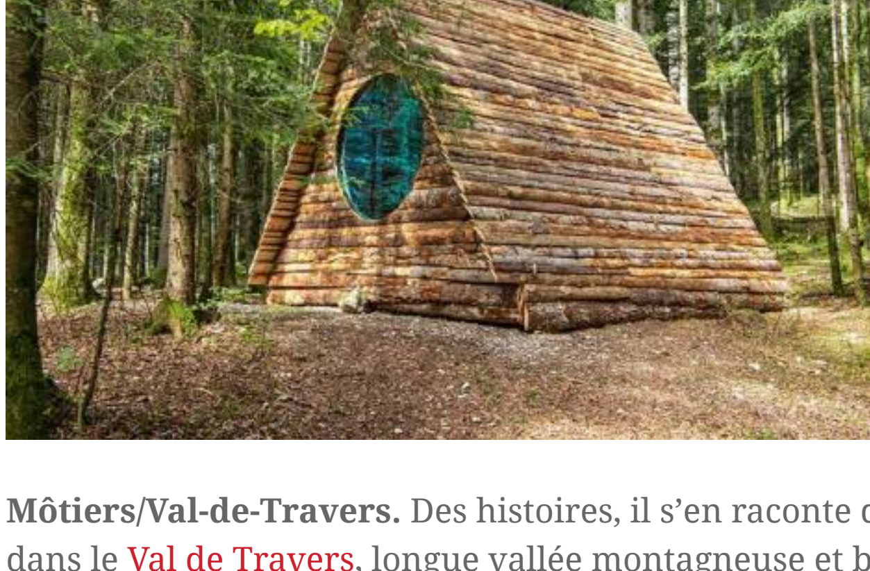
Alexandre Joly, La Chapelle inversée .

Né d'une initiative locale, le parcours d'œuvres installées en plein air dans un vallon suisse offre une rencontre sans prétention entre l'art et le public.