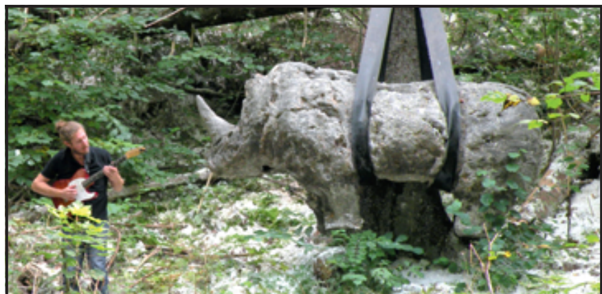
Au pied du rhinocéros, le clou du spectacle artistique.

en forêt », pose l'homme des bois. Un choix parfaitement justifié tant il sait faire partager sa passion. Et comme il a également participé à l'élaboration de différentes œuvres, il a pu ajouter des détails techniques à ses interventions plus poétiques autour de l'influence positive de la nature sur nos vies. La quinzaine de personnes qui lui ont emboîté le pas ce mardi après-midi-là n'ont pas regretté le déplacement. Tout à coup, de l'agitation dans les rangs et quelques murmures commencent à émerger discrètement. « Il va se passer quelque chose vers l'œuvre du rhinocéros », me glisse ma voisine. En regardant autour de moi, le musicien avait soudainement disparu et l'ombre avait à nouveau filé à l'anglaise. Que nous préparait-on encore ?